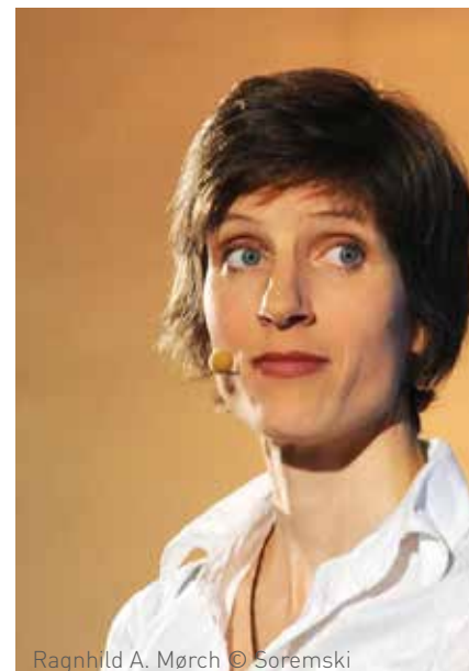
Ragnhild A. Mørch © Soremski

> Masterclass MIX UP organisée en continuité de la masterclass à Berlin de FEST en mars 2020, dans le cadre de l'appel à projet Word storytelling day de FEST dont bénéficie MIX UP.